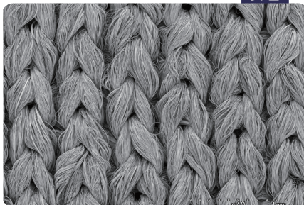
手のひらトレシー 表面